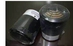
(交換用カートリッジ)